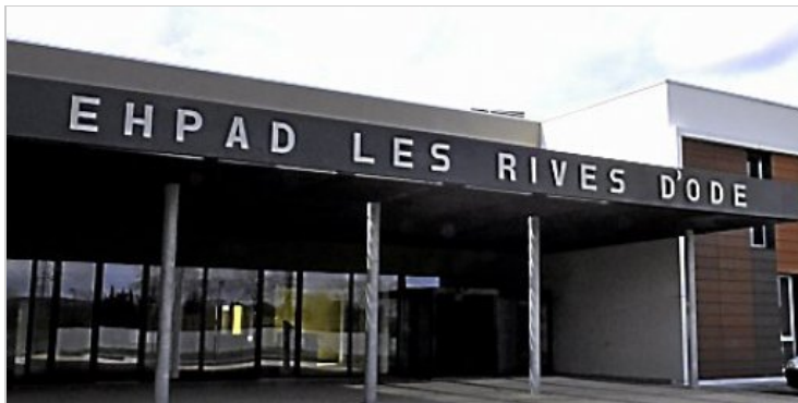
A l'ouverture de l'établissement, les familles avaient supporté 300 € d'augmentation. (N.A.-V.)

L'établissement des Rives d'Ode est tout neuf. Du coup, les familles des résidents doivent payer 300 euros de plus par mois. Et ils viennent d'apprendre qu'un poste d'aide-soignant de nuit pourrait être supprimé... L'exaspération bat son comble.