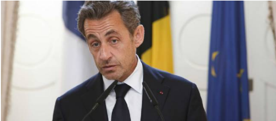
Nicolas Sarkozy en mars 2013.

Longtemps mystérieux sur ses intentions, Nicolas Sarkozy ne s'en cache désormais plus. Oui, il veut revenir, par envie ou par devoir.