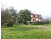
Vente Maisons / Villas 120m² à CASTELSARRASIN (82100)

TOUTES LES ANNONCES + LES ANNONCES IMMOBILIÈRES +