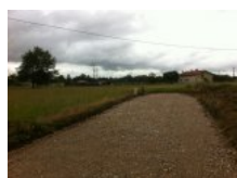
Vente Terrains 1763m² à Castelsarrasin (82100)