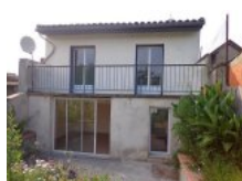
Vente Maisons / Villas 90m² à CASTELSARRASIN (82100)