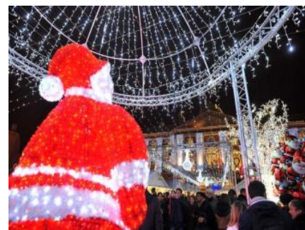
Le maire de Toulouse a donné le top des illuminations de Noël