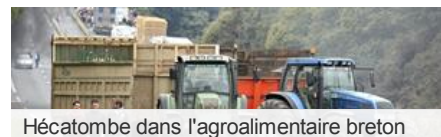
Hécatombe dans l'agroalimentaire breton