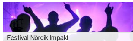
Festival Nördik Impakt