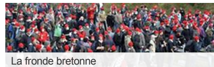
La fronde bretonne