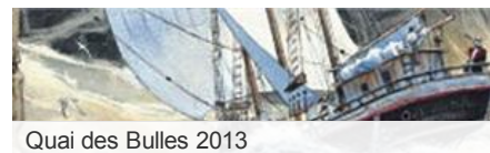
Quai des Bulles 2013