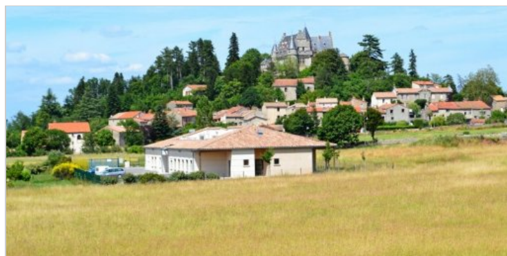
La maison de retraite avait ouvert il y a quatre ans seulement.

Midilibre.fr 25/10/2013, 17 h 45 | Mis à jour le 25/10/2013, 18 h 02 Recommander 8 +1 0 5 réactions