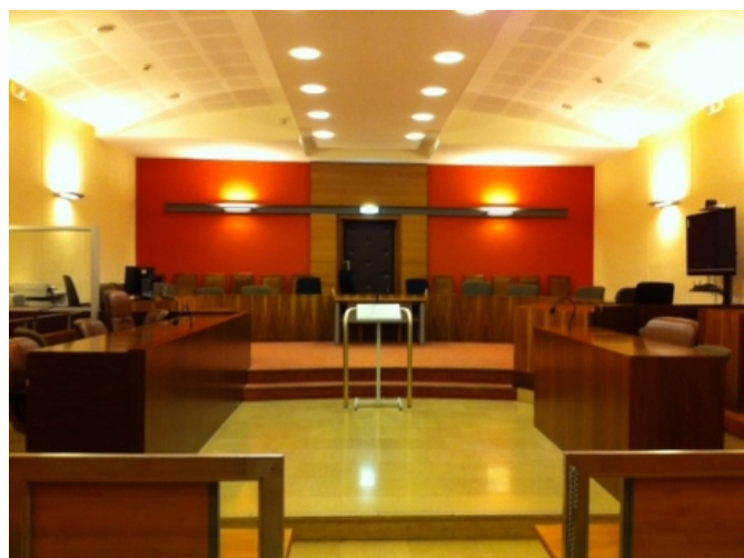
La grande salle d'audience du palais de Justice de Valence

Elle comparaisait ce vendredi pour "violence sur personne vulnérable" ... Avant son licenciement en 2010 de l'EPAHD La Pousterle dans le sud Drôme, elle aurait pratiqué des soins médicaux de façon trop brutale sur 2 personnes âgées sans prescription médicale. Jugement le 4 octobre.