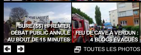
BURE (66) : PREMIER DÉBAT PUBLIC ANNULÉ AU BOUT DE 15 MINUTES