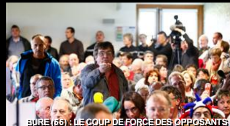
BURE (66) : LE COUP DE FORCE DES OPPOSANTS