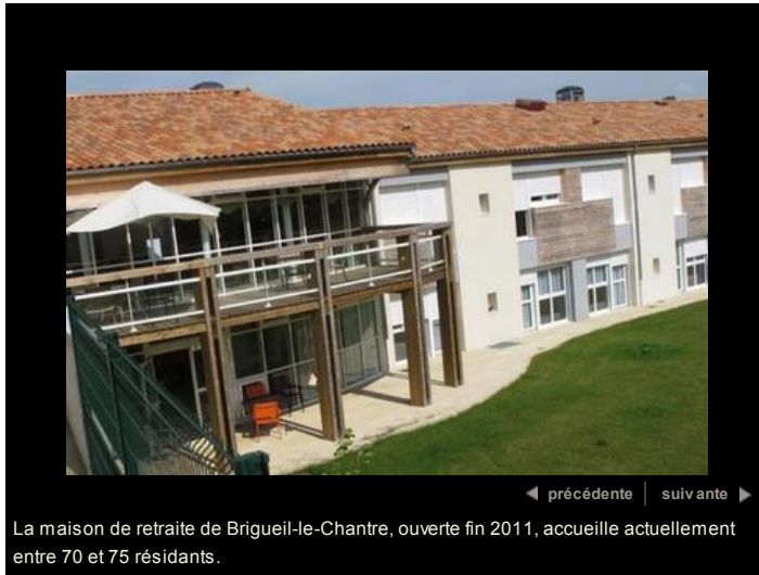
La maison de retraite de Brigueil-le-Chantre, ouverte fin 2011, accueille actuellement entre 70 et 75 résidents.