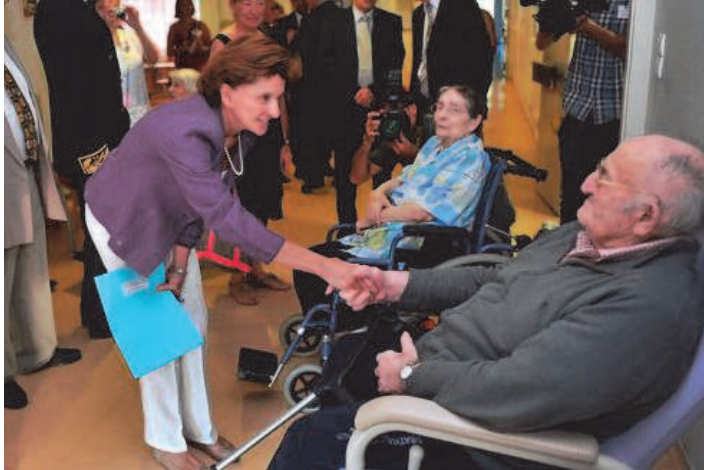
La ministre déléguée chargée des personnes âgées, Michèle Delaunay, visitant un EHPAD, en août dernier.

Mis à jour le 26/02/2013 à 01:02 | publié le 25/02/2013 à 23:49 Réactions (4)