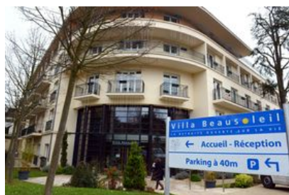
C'est de cet établissement cossu et au prix de journée de 126 euros minimum qu'a été expulsée une vieille dame.